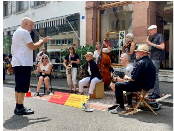
Die Jam-Session zum Ende