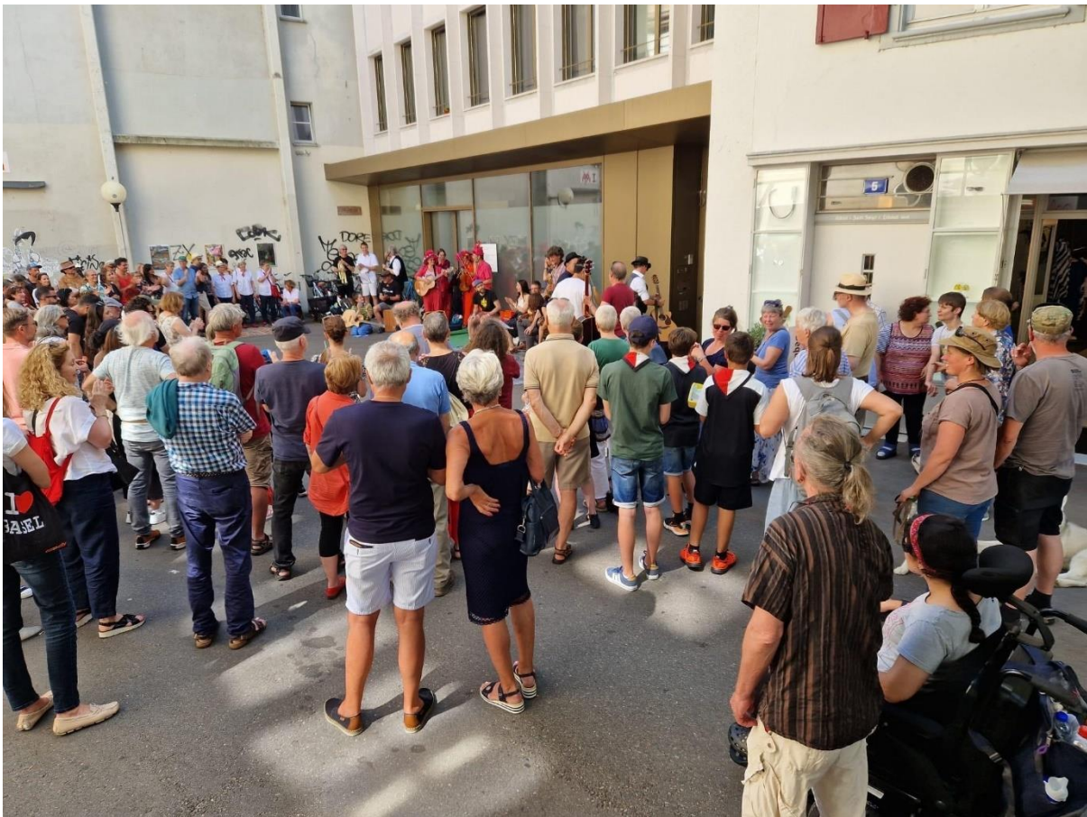
Die Jam-Session zum Ende